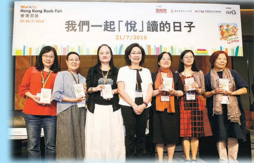
▲特首夫人梁唐青儀(中)與兩岸三地的作家合照