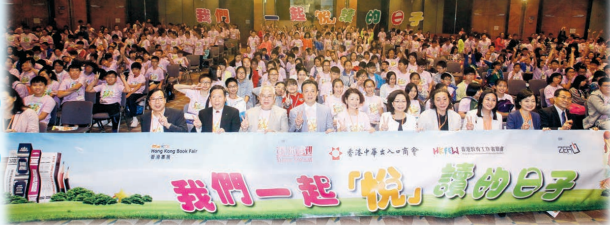
▲一眾嘉賓與近600名學生出席「我們一起『悅』讀的日子」活動，場面熱鬧。

童年時偶爾接觸書籍，孜孜不倦地追看，從此戀上了閱讀，使生命充滿色彩。亞洲週刊、香港中華出入口商會、香港教育工作者聯會為鼓勵香港學生喜愛閱讀，連續第二年在書展攜手舉辦「我們一起『悅』讀的日子」活動，並由零傳媒協辦。今次活動在書展期間舉行，主辦機構邀請600名中小學生出席，除與行政長官梁振英的夫人梁唐青儀及6名來自兩岸三地的少兒文學作家分享閱讀樂趣之餘，亦在義工陪同下一起逛書展、閱讀、買書及寫作，通過親身接觸體會閱讀的喜樂，並銘記這段難忘記憶。