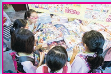
▲學生利用大會津貼購買多本書籍