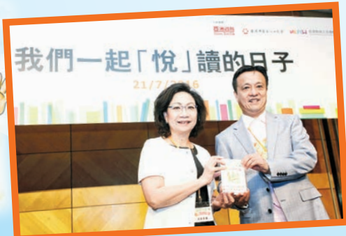
▲特首夫人梁唐青儀致送紀念品予榮譽主席姚志勝