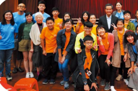
梁振英副主席與師生合影留念。

梁振英先生談到自己的閱讀歷程，他說道，在小學時，家裏沒有錢買書，所以陪伴自己的便是一毛錢一份的《工商日報》，從山川人物和花鳥蟲魚之中望眼世界。到了自己可以獨立外出時，最喜歡的便是去圖書館閱讀《三國演義》，其中三國人物的忠和