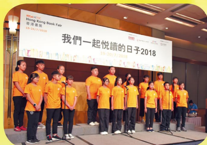
三地學生齊聲朗誦三字經

作為亞洲最大型的書展之一，一年一度的香港書展伴隨著濃郁的書香在7月18日盛大開幕了。許多大小「書蟲」一早提著行李箱，來到書展，準備「大展身手」搜羅知識寶藏。在這人人海之中，一陣讀書聲傳來，「人之初，性本善，性相近，習相遠……」咦？竟然是粵語和普通話交替的《三字經》朗誦？——原來這是「我們一起悅讀的日子2018」於7月19日活動開幕式中18位兩岸三地小朋友整齊的開場朗誦。