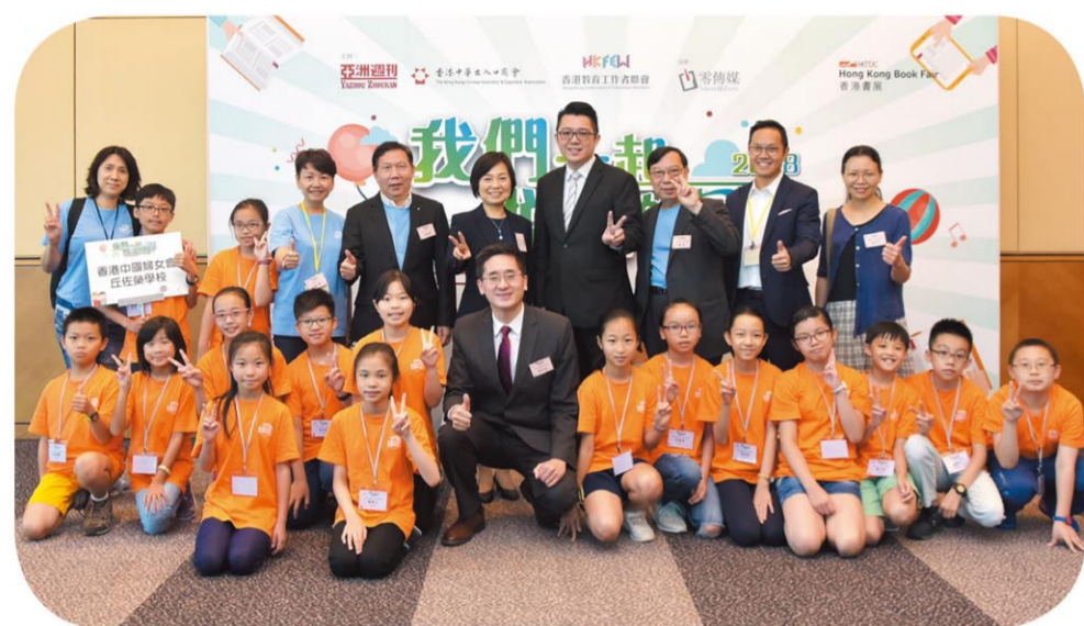
教育局副局長蔡若蓮（後排右五）、商務及經濟發展局副局長陳百里（前排中）與學生合照留念。

「我們一起悅讀的日子」活動已經邁入第六屆，香港中華出入口商會永遠名譽會長姚志勝太平紳士、郭英副團長、吳漢傑副團長擔任今年活動的榮譽主席，出錢出力，承擔了活動的全部費用。