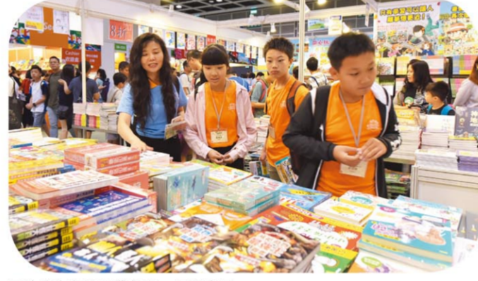
三地學生在義工帶領下同逛書展。