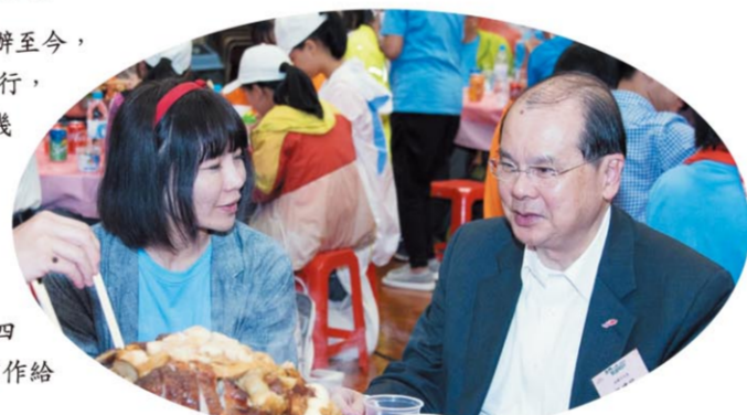
張建宗司長與三地師生共同品嘗傳統盆菜。

藉此機會感謝貴會、亞洲週刊和香港教育工作者聯合會，近年來聯合舉辦「我們一起悅讀的日子」活動，為同學帶來豐富且難忘的閱讀體驗。我特別欣賞你們將同學在去年活動中脫穎而出的優秀作品輯錄成《少年：閱讀、悅讀》一書，不但有助啟發同學們的興趣，更重要的是讓他們在閱讀的過程中認識自我、建立正確的價值觀，以至激發他們對未來的想像。