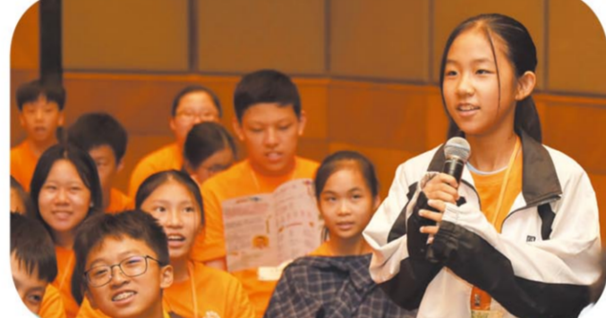
學生把握機會向作家提問，請教寫作及閱讀心得。